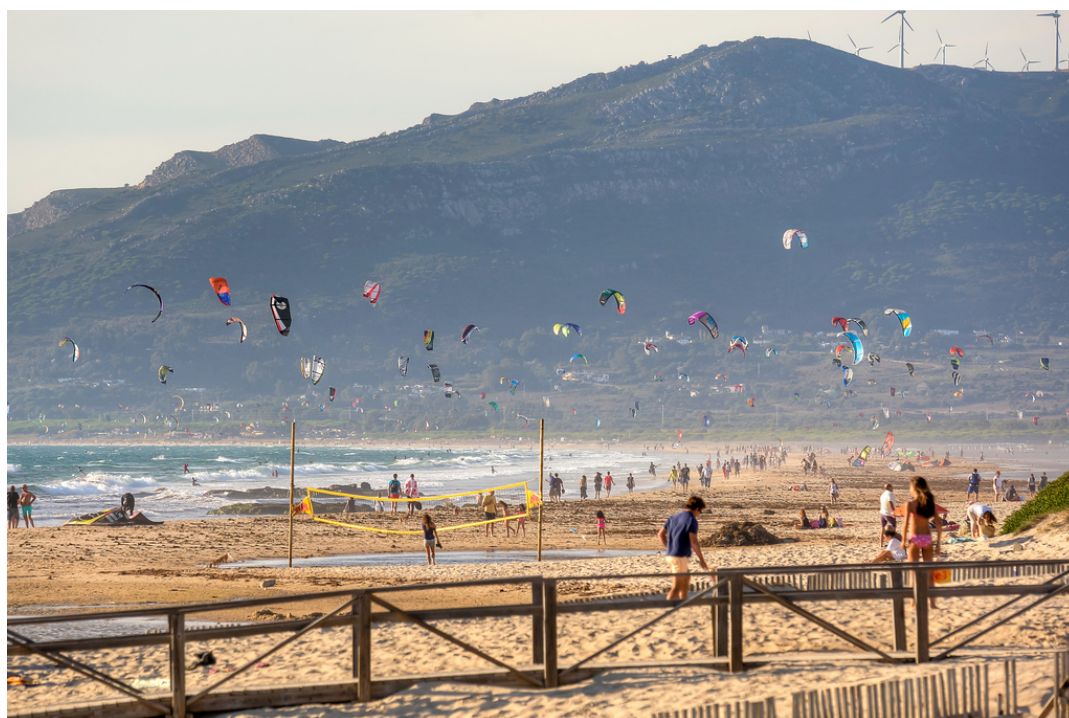
Fig. 4. Actividades deportivas en la Playa de los Lances.

Un caso similar al anterior es el ocurrido en la Playa de los Lances (Cádiz). Este arenal, localizado en el municipio de Tarifa, sí se trata de un espacio natural protegido. Por un lado, conforma el Paraje Natural Playa de los Lances y, por otro, pertenece al Parque Natural del Estrecho. Es frecuentemente visitado por las aves migratorias pero también por los turistas por dos grandes motivos: se trata de una playa que presenta un buen estado de conservación (algo cada vez más escaso ypreciado en ciertas costas de España) y, por su situación geográfica y características, es un lugar ideal y conocido mundialmente para practicar algunos deportes acuáticos (Fig. 4). Recientemente se ha dotado a la playa de nuevas infraestructuras para mejorar su accesibilidad, como la construcción de una pasarela de madera en 2008, que se tradujo en un incremento enorme de la afluencia de personas. La realización de censos en la playa ha arrojado a la luz una disminución sustancial de las especies de mayor interés en la playa (chorlitejo patinegro, chorlitejo grande, correlimos tridáctilo, etc.) a raíz de la construcción de dicha pasarela y el aumento consecuente de visitantes. Además, al igual que en el caso del oso, se apreciaba que las aves que no habían abandonado el arenal dedicaban una buena parte de su tiempo a vigilar y huir disminuyendo por ello el tiempo dedicado a su alimentación e higiene (Martín, 2014).