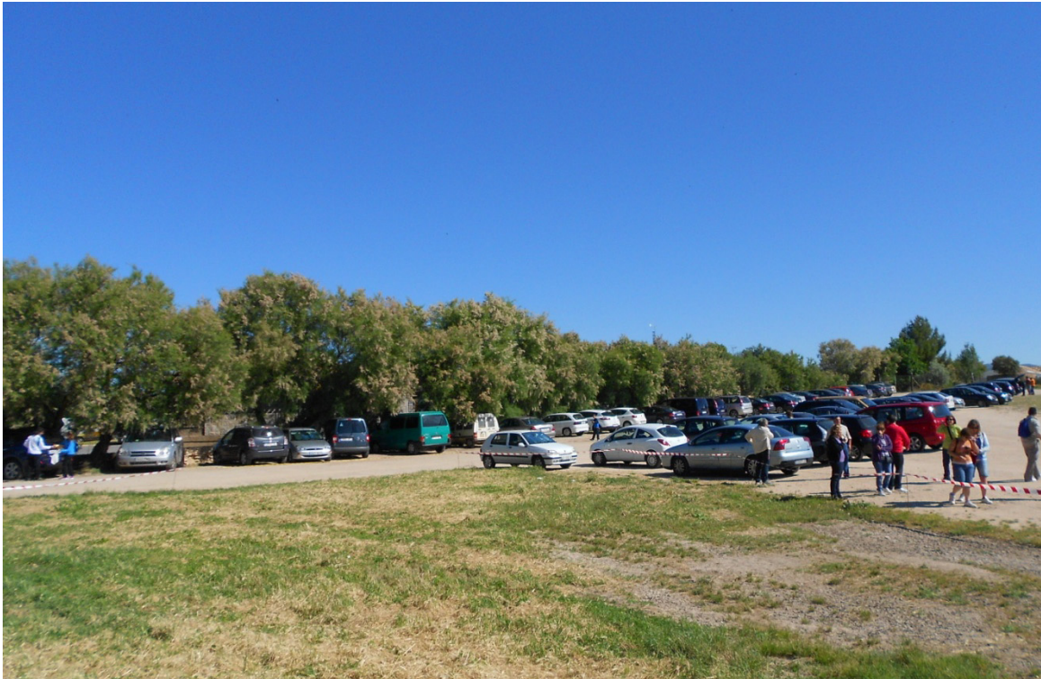
Fig. 1. Aspecto del aparcamiento exterior (utilizado cuando se llena el interior) del Parque Nacional de las Tablas de Daimiel el 1 de junio de 2013 a las 9:50 horas.

Uno de los estudios más ejemplares sobre esta cuestión es el realizado por Serrano de la Cruz (2002) sobre el Parque Natural de las Lagunas de Ruidera, lugar paradigmático en la concentración espacio-temporal de los visitantes y los impactos que de ello derivan. La actividad turística en el parque está orientada principalmente al turismo de sol y playa, lo que provoca una afluencia masiva de personas durante los meses estivales y los fines de semana de primavera y principios de otoño con buen tiempo. Conteos realizados por el propio parque han llegado a arrojar cifras tan espectaculares como los 200.000 visitantes que se han venido contabilizando en los meses de agosto en un espacio que, hay que tener muy en cuenta, es de pequeñas dimensiones y que no todas las lagunas reciben la misma afluencia turística. Según este trabajo, el 80% de los visitantes se concentran en los meses de verano (junio, julio, agosto y septiembre), abarcando agosto nada más y nada menos que el 40%. Dicha afluencia se concentra, además, los fines de semana e incluso en tramos horarios muy concretos. Esto deriva en una presión turística en periodos concretos del año que provoca daños y problemas de diversa índole: degradación de la vegetación, contaminación acústica e hídrica, generación de residuos, etc.