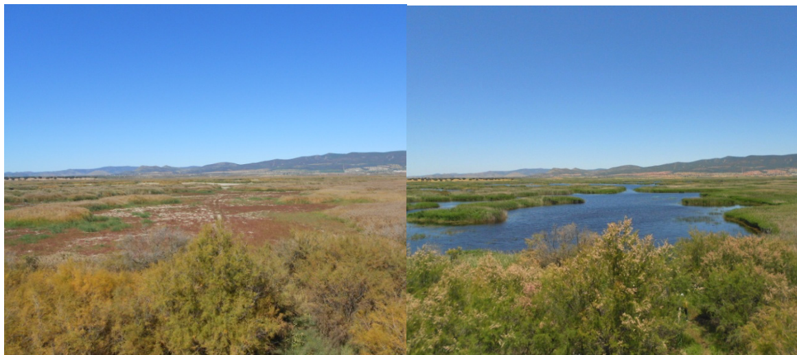
Fig. 2. Diferentes niveles hídricos en el Parque Nacional de las Tablas de Daimiel, a la izquierda octubre de 2012 y a la derecha junio de 2013.

pasando un importante periodo de sequía que apenas inundaba 18 hectáreas de 1.750 que hay potencialmente inundables 4 . Por tanto, la variabilidad de los niveles hídricos (Fig. 2) en ENP también debe tenerse en cuenta para gestionar estos espacios, puesto que su fluctuación entre un año u otro repercuten en el interés turístico.